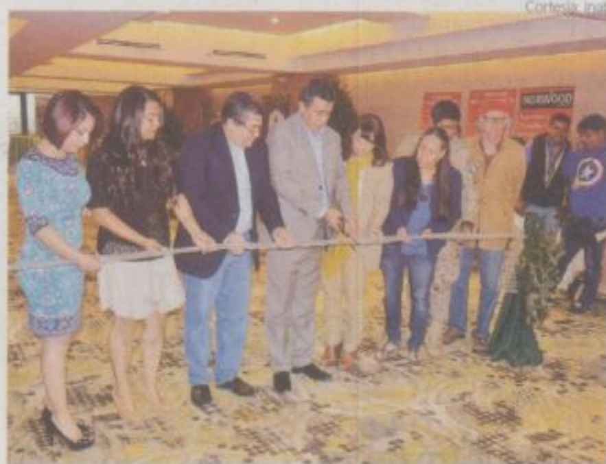
El viernes fue inaugurada la XI Feria Nacional de Pinabete, que pone a la venta arbolitos producidos bajo controles establecidos.

Con base en ello, el castigo consistió en que tuvieron que participar en campañas para promover y concienciar a la población sobre la importancia de conservar esta especie y de las secuelas negativas de la deforestación, por lo que distribuyeron y divulgaron contenidos acerca del tema con afiches que ubicaron dentro de su comunidad. Asimismo, cultivaron y cuidaron 50 arbolitos que fueron donados por la comunidad local.